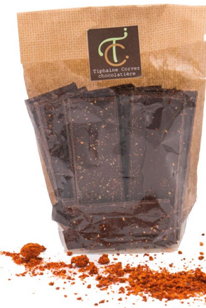
Croq' Piment (noir) 100g : 7,50 €