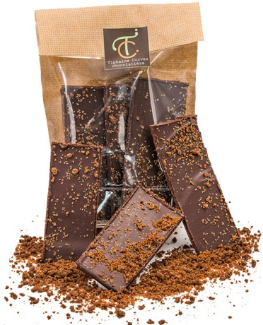
Croq' Spéculoos (noir) 100g : 7,50 €