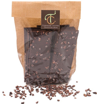
Croq' Grué (noir) 100g : 7,50 €