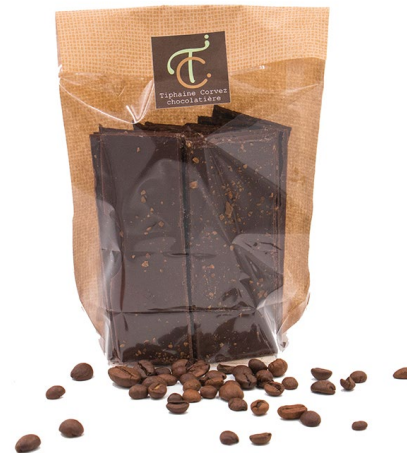
Croq' Café (noir) 100g : 7,50 €