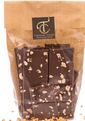
Croq' Noisette (lait) 100g : 7,50 €