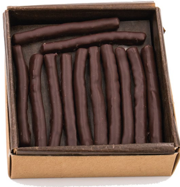
Orangettes T1 - 135g : 13,50 € Orangettes T2 - 250g : 21,50 €

Découvrez tous nos fruits confits enrobés de notre chocolat noir