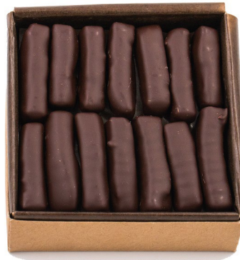
Gingembrettes 190g : 19,00 €