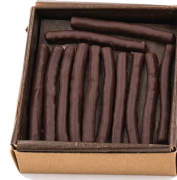
Citronnettes 145g : 12,00 €