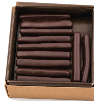
Mix Aiguillettes (mélange de toutes nos aiguillettes) 300g : 25,50 €