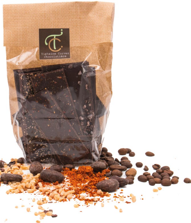
Croq' Mixte, un mélange de tous nos Croq's au chocolat noir 100g : 7,50 €

Spéculoos, piment d'Espelette, noisette, café ou grué de cacao