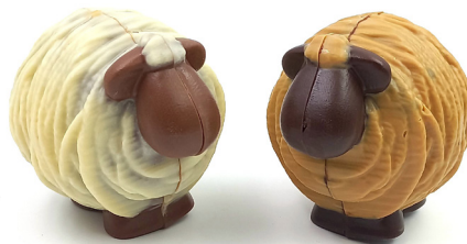
Brice Le mouton Blanc/lait ou Noir/dulcey 11,50 € 120g