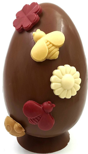
Oeuf printanier Lait/inspiration ou Noir/inspiration 32,00 € 300g