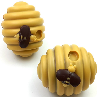
La ruche Passion lait ou passion noir 11,50 € 120g