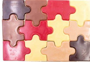
Puzzle inspiration Lait, noir, framboise, passion, blanc 12,50 € 70g