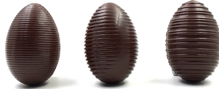
Petit oeuf Lait ou noir 3,80 € 40g