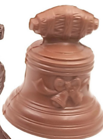
Cloches Noir ou Lait