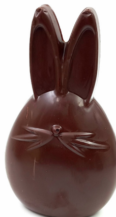
Lapin moustache Lait ou noir 13,10 € 150g