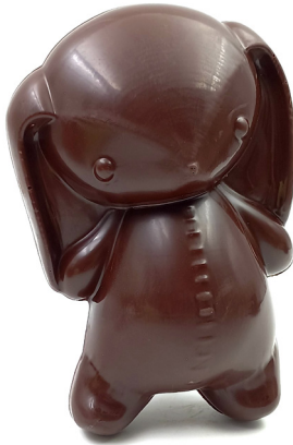
Lapin peluche Lait ou noir 15,60 € 180g