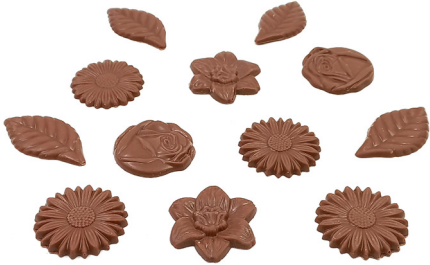
Fritures Noires, lait ou mixtes 7,50 € 100g