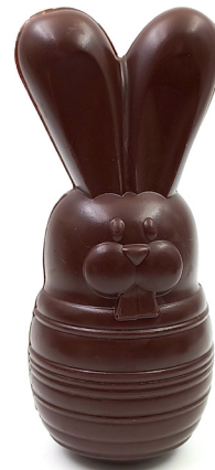
Lapin Momie Lait ou noir 8,90 € 100g