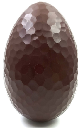
Oeuf dragon Lait ou noir 15,60 € 180g Blanc 16,60 € 180g