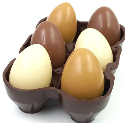
Boîte d'oeufs Mélange Noir, lait, dulcey 23,00 € 200g