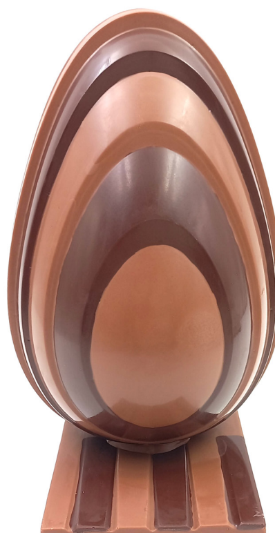
Oeuf design Mixte 45,00 € 500g