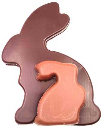
Tablette lapin Mixte 8,90 € 100g