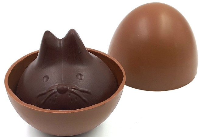
Oeuf surprise Mixte dominance noir ou Mixte dominance lait 19,00 € 220g