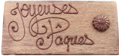
Plaque Joyeuses Pâques Lait ou noir 12,00 € 150g