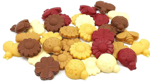
Fritures fantaisies Mixte 8,00 € 80g