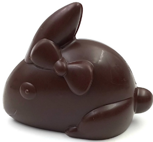
Mini lapin Lait ou noir 3,80 € 40g