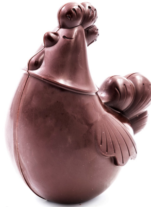
Cocotte Noir ou lait 19,00 € 220g