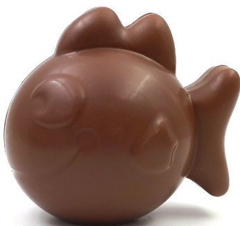
Bob le poisson Lait ou noir 13,10 € 150g