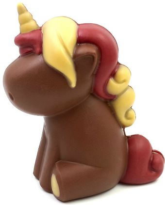
Licorne Noir ou lait avec framboise et passion 14,30 € 150g